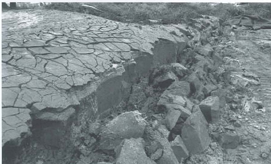
Bild 5: Entwässertes Baggergut – offener Schlauch